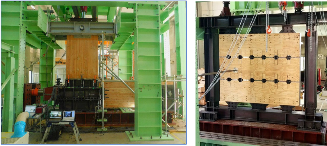
【実大実験の様子（左：GIUA、右：シアリングコッター耐力壁）】