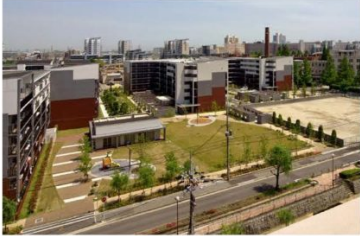
沿道に開いた公園

既存児童遊園に建替住宅(受皿)を建設し、移転の円滑化と負担軽減を図る。公園代替地は沿道に配置し、沿道の景観・賑わい形成、団地エントランス空間の形成を図る。