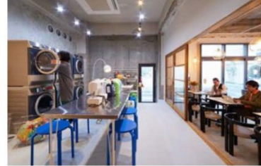
生活・交流機能 (ランドリーカフェ)