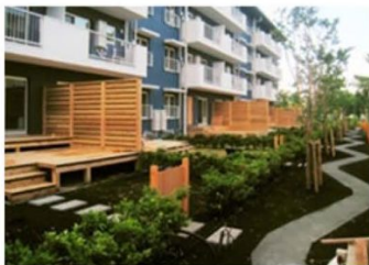
1階ベランダ改修+外構修景例

DIY 賃貸や就労支援付き住宅など住まい・人の多様化を図るとともに、住棟・外構改修によって居住魅力を高める。将来建替や用地活用を検討するリザーブゾーンとしても位置付ける。